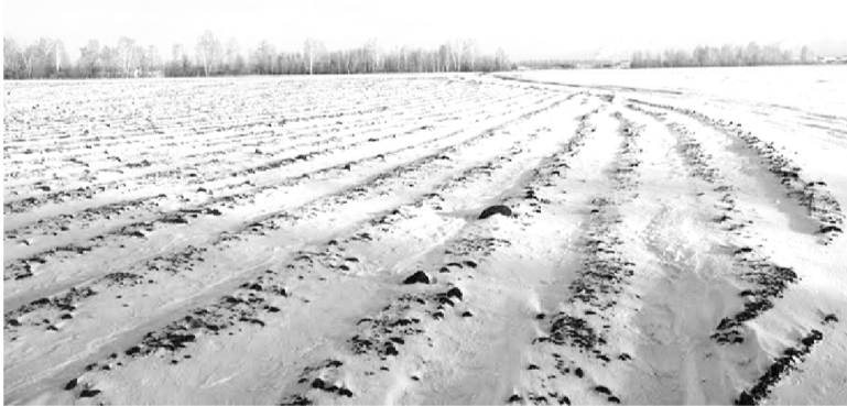
Пока на полях тишина.

году), в т.ч. сельхозорганизации – 25458 (плюс 104), фермеры – 3626 (плюс 72); среди сельхозпредприятий площади намерены увеличить в ООО «Калужский аграрий», «Русская земельная компания», «Алдена Фарм» и «ВИО»;